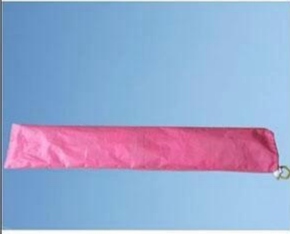
NO.3 Fabric bag