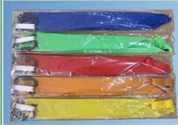
NO.2 PE bag